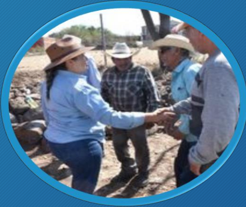
Impulso al Desarrollo Social y Humano