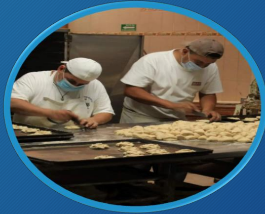
Impulso al Desarrollo Económico