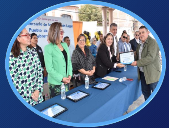
Impulso al Desarrollo Institucional de la administración Pública Municipal