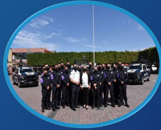
Impulso a la Seguridad Pública